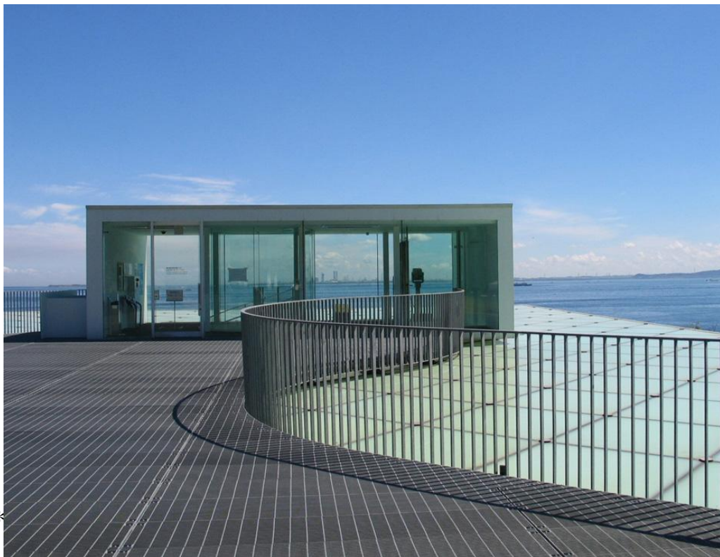
* CN artgene が選ぶ「絶景美術館トップ 5」の 5 位に選出されました。(2010.12)

そのためには、市内外に積極的に情報を発信して広い層に美術館の魅力をアピールすることで知名度や認知度を向上させていくことが必要と考え、実施目標として設定しました。